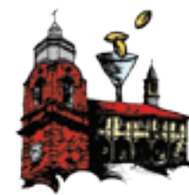
Pro Loco Parona

Grazie! "Parona tèra bõna" è un'iniziativa ideata e realizzata dalla Pro Loco di Parona, con il patrocinio del Comune. La Pro Loco ringrazia tutte le persone che collaborano con questa manifestazione, i privati che mettono a disposizione materiale d'epoca e coloro che si prestano per la riuscita di questa giornata... proprio d'altri tempi